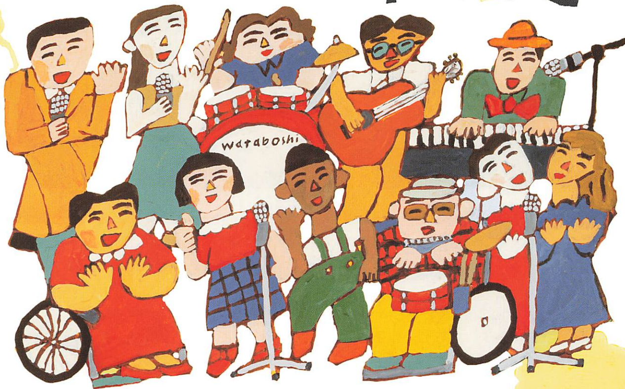
Illustration by HIRAMEGU SWOTEN Title Logo type by Nodoka Sasamura